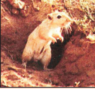
भारतीय मरु जरबिल

पश्चिमी राजस्थान में चूहों की लगभग 18 प्रजातियाँ पाई जाती हैं इनमें से खेतों—खलिहानों, चारागाहों में मुख्यतः 4-5 प्रजातियों के चूहे हानिकारक हैं, जैसे मरु जरबिल या भूरा चूहा, भारतीय जरबिल (बडी रतोल) रोम युक्त पैरों वाला जरबिल (छोटी रतोल), नर्म रोयें वाला मैदानी चूहा, गिलहरी इत्यादि। रिहायशी क्षेत्रों व गोदामों में इनकी 2 प्रजातियाँ जैसे घरेलू चूहा व घरेलू चुहिया हानि पहुँचाते हैं।