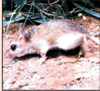
रोम युक्त पैरों वाला जरबिल (छोटी रतोल)