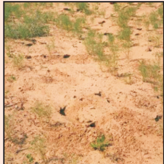
फसलों में चूहों की विध्वंसक गतिविधियाँ