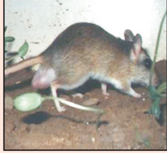
भारतीय जरबिल (बडी रतोल)