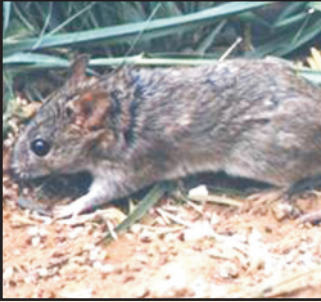
नर्म रोम वाला मैदानी चूहा